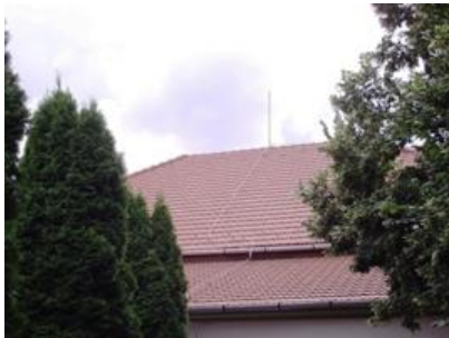
Az idén felújított tető

A tavalyi évben az óvoda személyi összetételén is elkezdtünk változtatni, így ma egy egységes, főként fiatalokból álló közösség kezd csapattá formálódni, akikért nagyon hálásak vagyunk. Munkájuk felbecsülhetetlenül értékes!