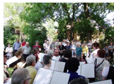
Az ideai látogatás egyik pillanata

A Nagybánya Újvárosi Református Egyházközséggel az idén ünnepeltük tíz éves kapcsolatunkat. Immár hagyománnyá vált, hogy évente hol itt, hol náluk találkozunk, de folyamatosan tartjuk a kapcsolatot is, e-mailben és telefonon is. Az elmúlt években személyes barátságok is kialakulhattak már tagjaink között, akik meg-meglátogatják egymást „hivatalos” találkozóikon túl is.