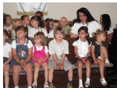
Az idei évváró egyik pillanata

Végezetül szólnom kell még az 1994 óta gyülekezetünk fenntartásában lévő óvodánkról is. Óvodánkba, három csoportba 75 gyermek jár, és nyolc óvónő, csoportonként egy dajka, valamint egy adminisztrátor, egy gondnok és egy konyhás dolgozik. Az évek alatt sikerült elérnünk azt, hogy dolgozóink lassan beépülnek a gyülekezetbe, és az óvoda így a közösség szerves részét képezze. Az intéz-