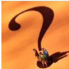
Merre tart az életed?

8. Egyetemes papság elve : A Szentírás alapján valljuk, hogy minden hívő ember pap. Joga és kötelessége a Szentírás tanulmányozása és az evangélium hirdetése. „ Ti azonban választott nemzetség, királyi papság szent nemzet vagytok... ” (1Péter 2,9)