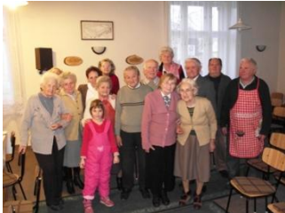
A Szépkorúak Közössége

Jászboldogházán minden hónap első és harmadik vasárnapján 16:00 órától tartunk istentiszteletet, és minden héten házi bibliaórát.