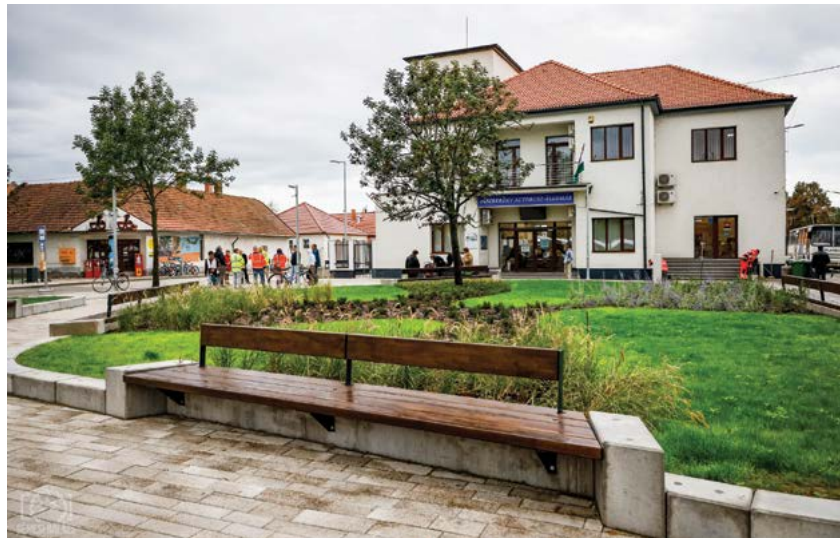
Az autóbuszpályaudvar korszerűsítése, megújítása a Volánbusz szolgáltatásait igénybe vevők számára és városunk lakói számára is örömteli esemény volt. Régen vártunk már rá, s az előző ciklusban elkezdett és most befejezett beruházáshoz jelentős pályázati támogatás is érkezett.