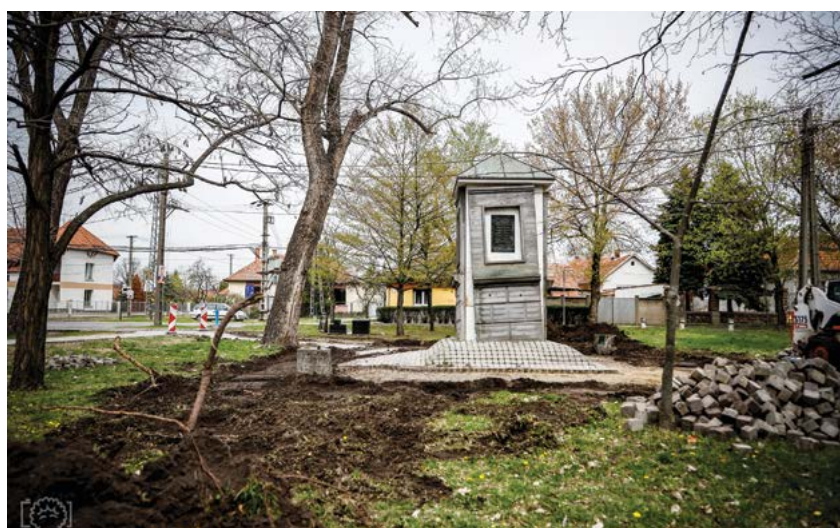
Idén 550 éves a Jászberényi Ferences Templom. Ez remek alkalmat teremt arra, hogy a park tavaly elkezdett felújítása az idei évben az 56-os emlékmű megújulásával folytatódjon. Ez magában foglalja a térburkolatot, valamint a járda megújítását és kiszélesítését, a megvilágítást szolgáló építmények megtisztítását, a vas elemek rozsdátlanítását, fedőmázás festését.