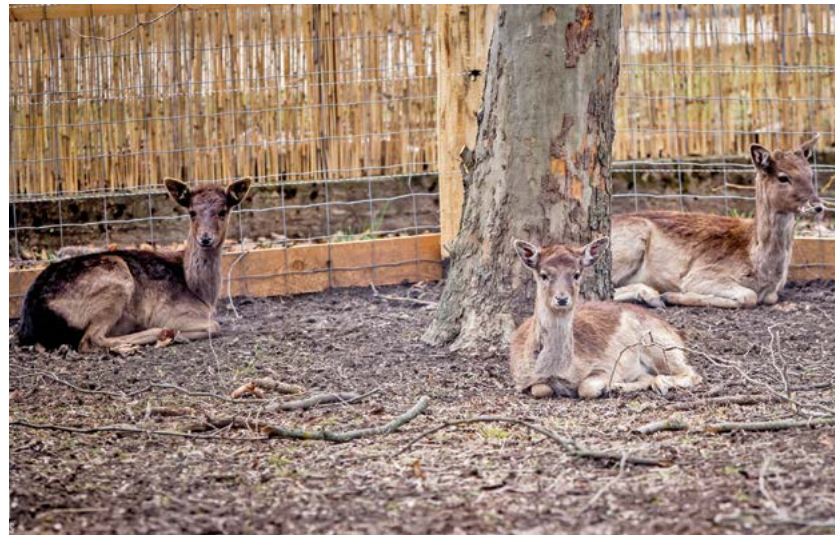
A Jászberényi Állat- és Növénykertben zajló felújítási munkálatok továbbra is folyamatosan haladnak. A projektben számos új kifutó- és bemutatóhely épül, melyek közül a látogatóközpont mögötti dámszarvas kifutó elkészült. A három kis dámszarvas már beköltözhetett az új kifutóba, beszerzésük az állatkert közreműködésével és támogatásával történt.