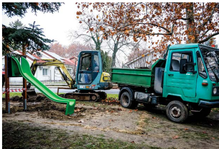
Megújult a Gorjanc Ignác utcai játszótér. A JVV NZrt. munkatársai az elbontott játszótéri eszközöket pótolták. Lerakták a szegélyköveket és kialakították az ülőfelületeket is.