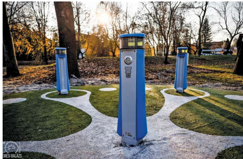
A Margit-szigeten a fitnesspark és a játszótér átadása után közel 20 millió forintba került az interaktív játszótér kialakítása, amely rövid idő alatt népszerű lett.