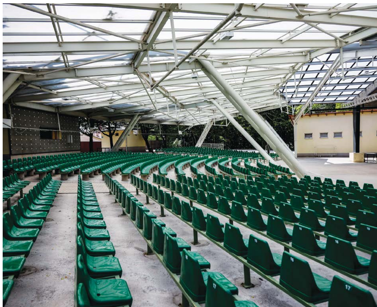
A Székely Mihály Szabadtéri Színpad környezetének megújítása mellett a színpad felújítása is megtörtént. A sok nyári, szabadtéri esemény helyszíne így megszépülve várja a közönséget. Az új színpadot egy Tankcsapda koncert avatta. Itt rendezték meg hosszú szünet után ismét a LEHEL RockFesztet, melyet nagy érdeklődés kísérte. Az itt megrendezett programok rendre teltház előtt zajlanak.

A Déryné Rendezvényházban egy korábbi fejlesztési elképzelés valósult meg. Megépült az intézményben a lift, s ezzel a mozgáskorlátozottak számára is elérhetővé vált az emeleti nagyteremben való eseményeken való részvétel. A kulturális terek kapcsán mindenképpen érdemes megemlíteni, hogy az Ifjúsági Házban, a Főnix Műhelyházban és a Lehel Film-Színházban is jelentős felújítások történtek. Folyamatosak a fejlesztések a nagyvisnyói tábortan, amely így egyre nagyobb szerepet ját-