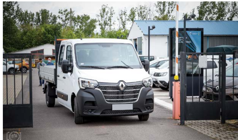
A közmunkások által a fóliasátrakban és a szabadban megtermelt zöldségek a szociális intézményeinkben kerültek felhasználásra. Eredményes volt a homoktövis termesztés is, ennek értékesítéséből megvásárolhattunk egy teherautót, amely a közmunkaprogramban folyó termelést segíti majd.